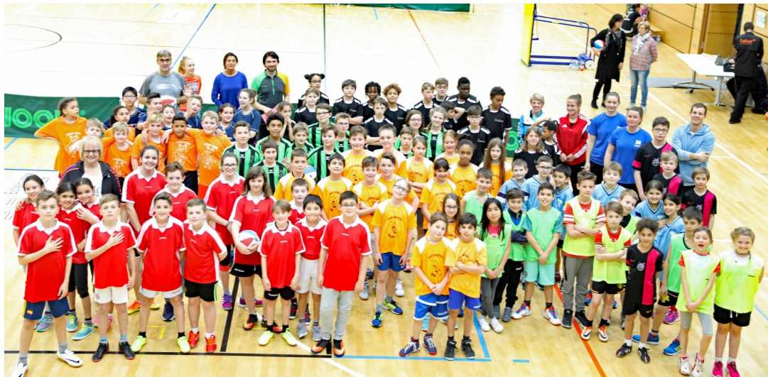
Fête de Basketball à Bertrange